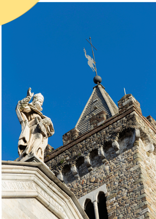
Campanile della Chiesa di Santa Maria Assunta (Sarzana)

All'indomani del fortunoso ritrovamento era necessario dare risposta ad una serie di domande: perché tutti quegli oggetti erano stati inseriti all'interno della base in ferro? Chi li aveva inseriti? Come si sono conservati per tutto il tempo? Le risposte a queste domande sono arrivate grazie al restauro di ogni singola preziosa testimonianza e alla ricerca storico-archivistica.